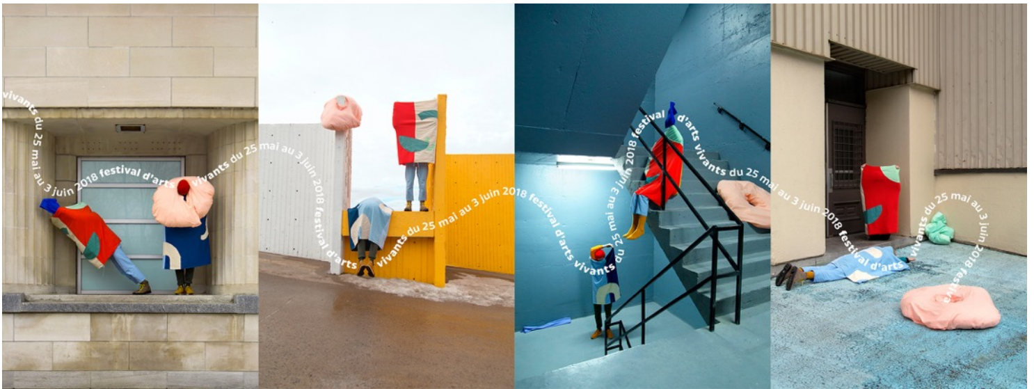
Les visuels de cette édition du OFFTA, ainsi que l'installation artistique qui se trouvait à la Balustrade du Monument-National pendant le festival, sont des œuvres réalisées par les artistes visuelles Pénélope et Chloë.